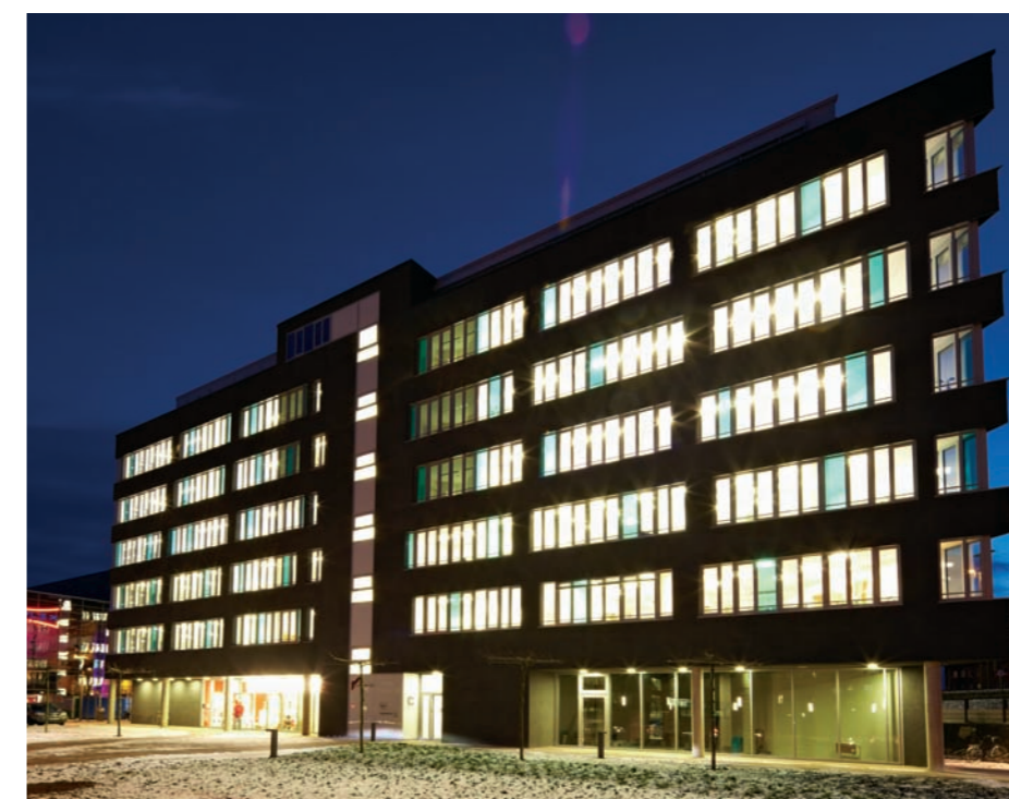
PortAL 10, Büro- und Ärztehaus in Münster