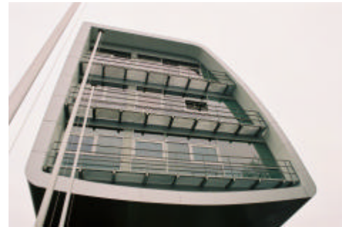
Hamburg Sternschanze / Gruppe MDK, Architektur u. Stadtplanung, Köln